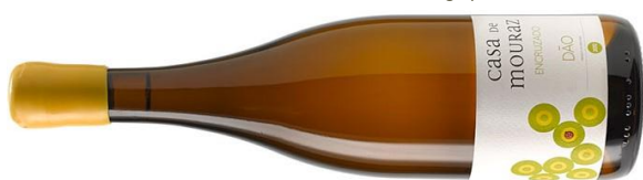
Millesime Bio 2014 : GOUD

Biedt deze wijn enkele jaren kelderrust en er wacht je een feestje.